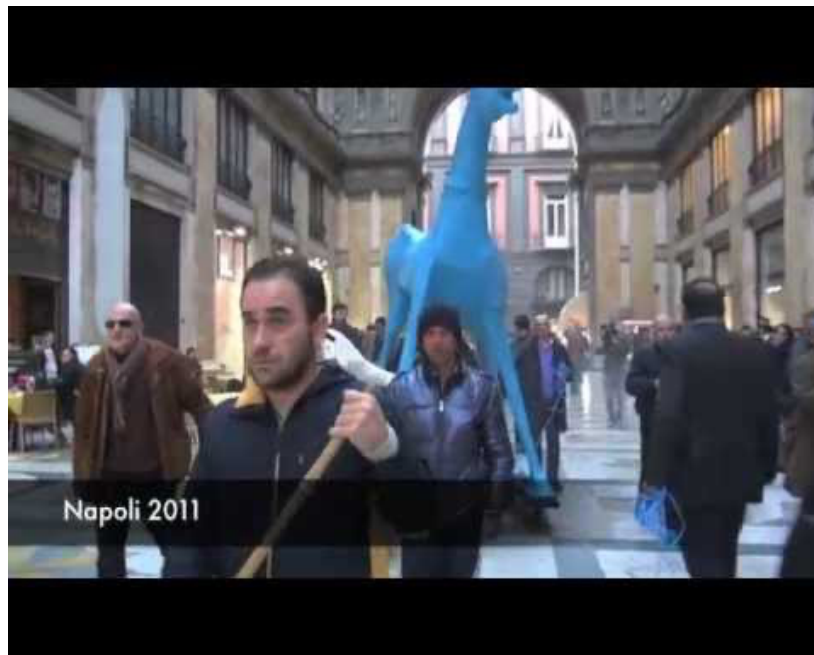
I Viaggi di Marco Cavallo (Fuori Onda Video) https://www.youtube.com/watch?v=cMk7qtna3R4